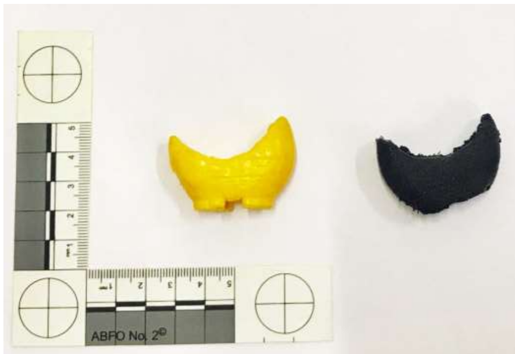
Figura 02 - Material rígido de plástico ABS na coloração amarela, material flexível borrachóide na coloração preta, para análise de compatibilidade da mordida.

O alimento escolhido para realização da perícia foi o queijo, devido a quantidade de casos existentes na literatura, indicando-o como bom material para análise.