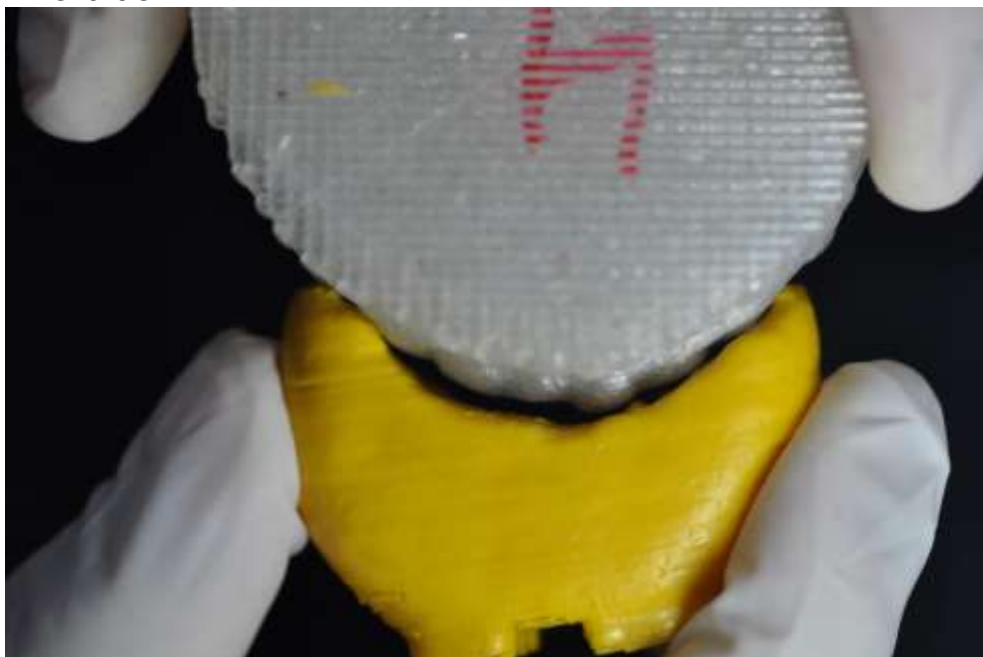
Figura 04 - Aproximação do suporte do suspeito 4 com o material rígido mordido.